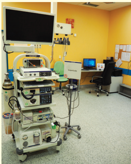
Nové koloskopické pracoviště ON Jičín

Gastroenterologie je jedním z největších oborů vnitřního lékařství a digestivní endoskopie je nezbytným nástrojem diagnostiky i terapie. V Oblastní nemocnici Jičín a.s. byl od počátku roku 2019 výrazně rozšířen endoskopický provoz.