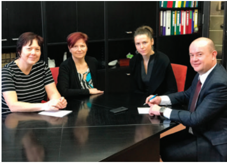
Návštěva ve SZŠ Hradec Králové

Vedení Nemocnice v Rychnově nad Kněžnou zavítalo začátkem roku na střední zdravotnické školy v blízkém okolí. Cílem bylo představit novinky v nemocnici a navázat užší spolupráci při praxích studentů. Ředitel s náměstkyní pro ošetrovatelskou péči a ombudsmankou ON Náchod navštívil ale i Univerzitu Pardubice - fakultu zdravotnických studií, kde by chtěli oslovit budoucí možné zaměstnance.